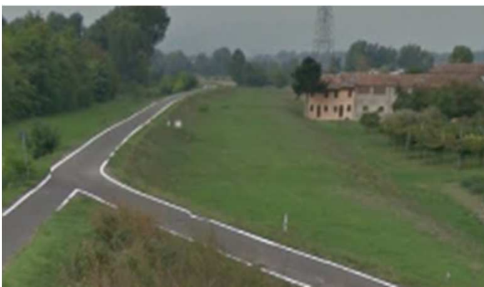
ciclabile Marco Pantani

Negli ultimi anni stiamo assistendo ad un incremento delle ciclabili nel territorio veronese , con opere importanti come ponti e asfaltature di strade sterrate di campagna e con questa gita vogliamo far conoscere a tutti il patrimonio paesaggistico e ambientalistico del nostro territorio. L'Adige e i relativi affluenti come fossi , progni e canali sono i principali soggetti di questa importante crescita di percorsi ciclopeditoni .